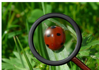
Lepatriinu luubi all

Mikroskoop suurendab suurendatud kujutist.