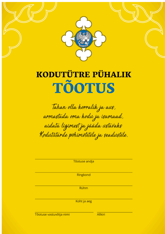
Kodutütarde isikliku töotuseleht esikülg