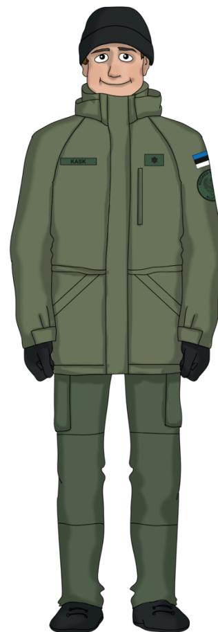
Talvemütsi kandmine jopega