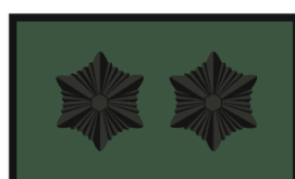
Malevkonna pealiku abi Jaoskonnavanema abi