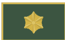
Maleva pealiku abi Ringkonnavanema abi, Malevkonna pealik, jaoskonnavanem Noorteinstruktor