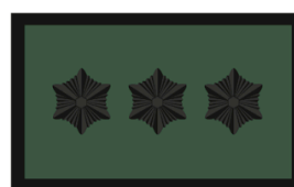
Rühmapealiku abi Rühmavanema abi