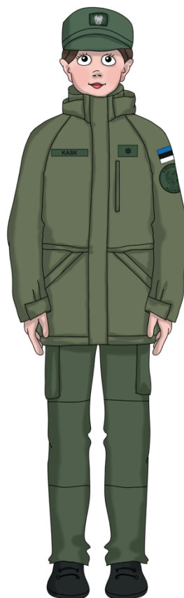
Nokkmütsi kandmine jopega