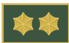
Peavanema abi Maleva pealik, ringkonnavanem