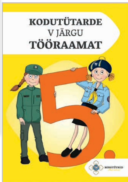
Joonis 3. Kodutütarde VI ja V järgu tööraamatud.