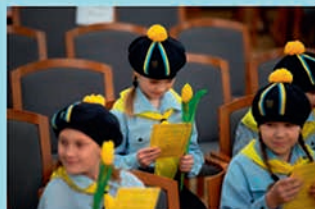
Värsked kodutütred pidulikul koondusel liikmeks astumas.

Tahan olla korralik ja aus, armastada oma kodu ja isamaad, aidata ligimest ja jääda ustavaks kodutütarde põhimõtetele ja seadustele.