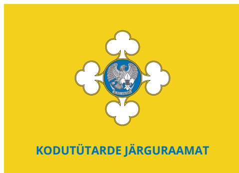
Joonis 1. Kodutütarde järguraamat

Rühmavanemat ja noorliiget abistab järkude läbimisel järguraamat. Raamatus on punktideni välja toodud kõik järgukatsete nõuded. Iga teema sooritamisel saab noor allkirja vastava punkti juurde. Sel juhul on nii noorel kui ka rühmavanemal ülevaade läbitud teemadest.