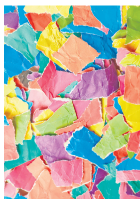
Värvilise paberi tükikesed