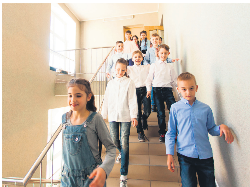
Liigu rahulikult koos õpetajaga