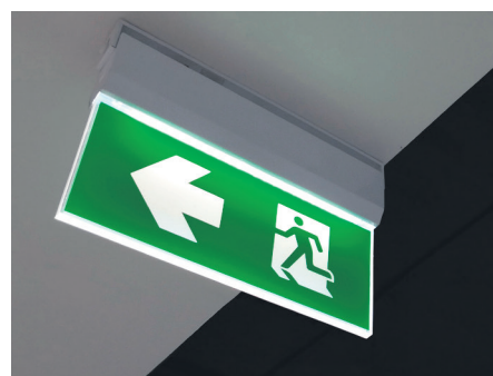
Rohelised välja-pääsu tuled