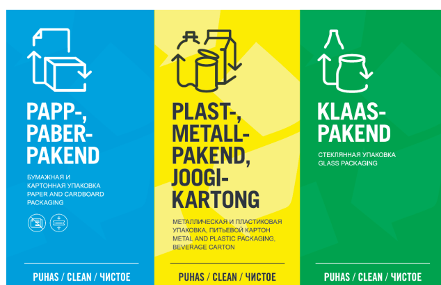
Sildid konteinerite peal