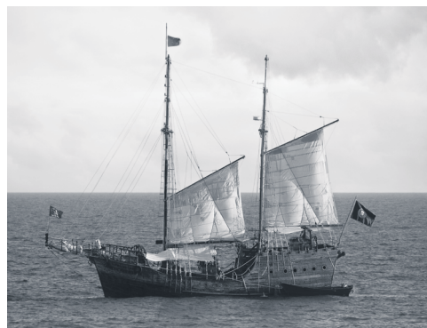
Vana aja laev

Hiljem hakkas arenema liiklus raud-teedel ja sõidu-teedel. Leiutati esimesed rongid ja autod.