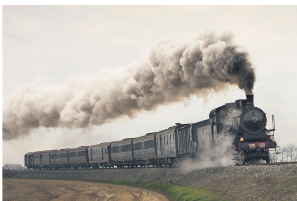
Vana aja rong