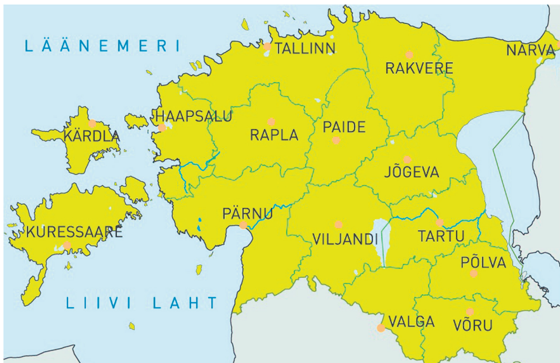
Eesti suuremad linnad

Eesti kõige suurem linn on Tallinn . Tallinn on Eesti pea-linn.