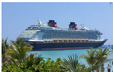
Kruisilaeval saab puhata.