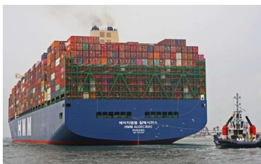
Maailma suurim kaubalaev Algeciras