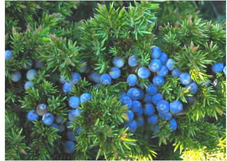
Kadaka käbid, rahvasuus kadaka-marjad

Harilik kadakas on levinud rohkem Lääne-Eestis.