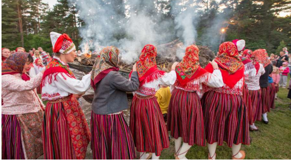
Traditsiooniline jaanipäev Kihnu saarel