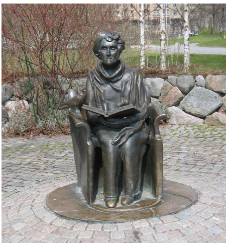
Rootsi lastekirjaniku Astrid Lindgreni skulptuur Stockholmis