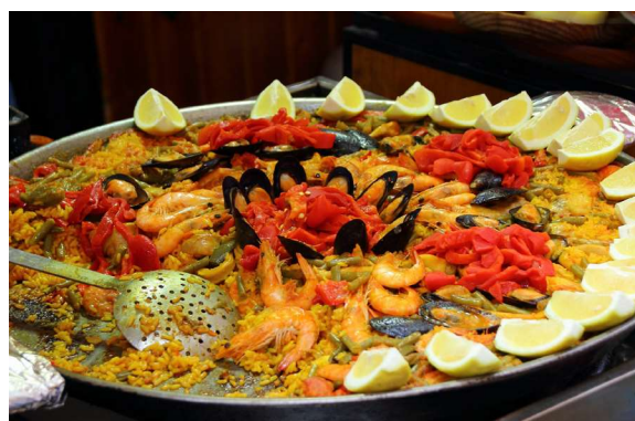
Reisil käies tasub proovida sealse riigi rahvustoite. Fotel Hispaania üks rahvustoite paella.