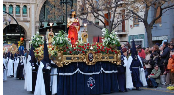
Hispaanias on olulised kirikupühad ja nendega seotud traditsioonid.