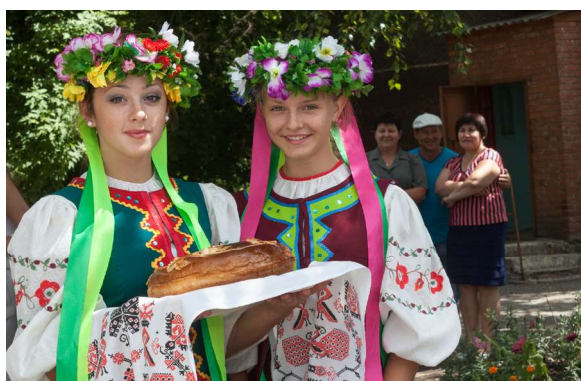
Ukraina traditsioonid – külalisi võetakse vastu ja külla minnakse soola-leivaga.