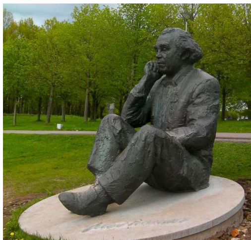
Eesti helilooja Gustav Ernesaksa skulptuur Tallinna lauluväljakul