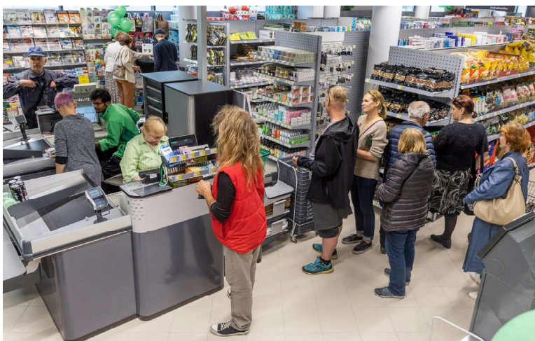
Poes ostude eest maksmas

Esita saadud teave kaasõpilastele. Arutage tulemusi klassis koos õpetajaga.