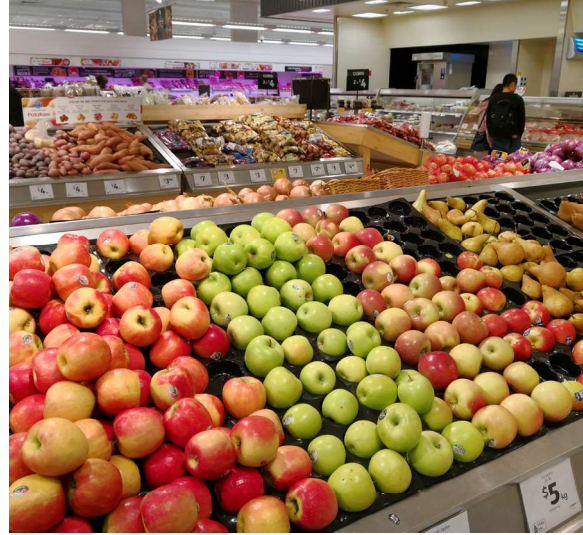
Teenindus – kaubandus