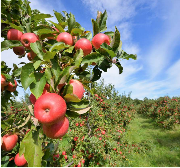
Tootmine – puuviljakasvatus