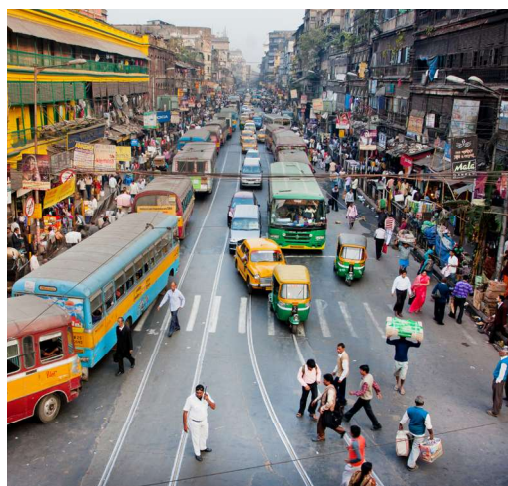
Liiklus Indias Kolkata linnas